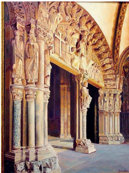
Portico de la Gloria

À l'époque suivante, les mêmes matériaux seront repris pour le Porche de la Gloire avec, toutefois, un enrichissement dans le décor des colonnes, des feuillages et des motifs divers.