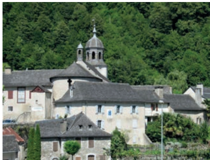
Le monastère Notre-Dame de Sarrance

Les pèlerins de Compostelle qui ont fait étape à Notre-Dame de Sarrance (Pyrénées-Atlantiques), sur les voies d'Arles et du Piémont, tout près de l'Espagne, se souviennent sans doute de leur accueil dans ce plus ancien monastère pyrénéen (XVII e ), situé à l'entrée de la vallée d'Aspe.