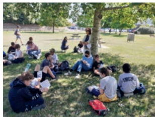
Remue-ménages à proximité de la borne 1 500 km : il faut remplir le questionnaire !

Le 14 juin dernier, à la demande de quatre collèges de Rezé (Sainte-Anne) ou de Nantes (Théophane Venard, La Madeleine et bien sûr Saint-Jacques de Compostelle), quatre membres de l'association ont marché avec quelque 200 élèves de quatrième accompagnés de plusieurs adultes : directeurs, enseignants, animateurs pastoraux ou auxiliaires de vie scolaire. Ce mini-pèlerinage de 7 km sur le chemin de Compostelle balisé par notre association, de Pirmil (Nantes) à la Chaussée-des-Moines (Vertou) constituait pour eux le point d'orgue d'une année d'animation pastorale.